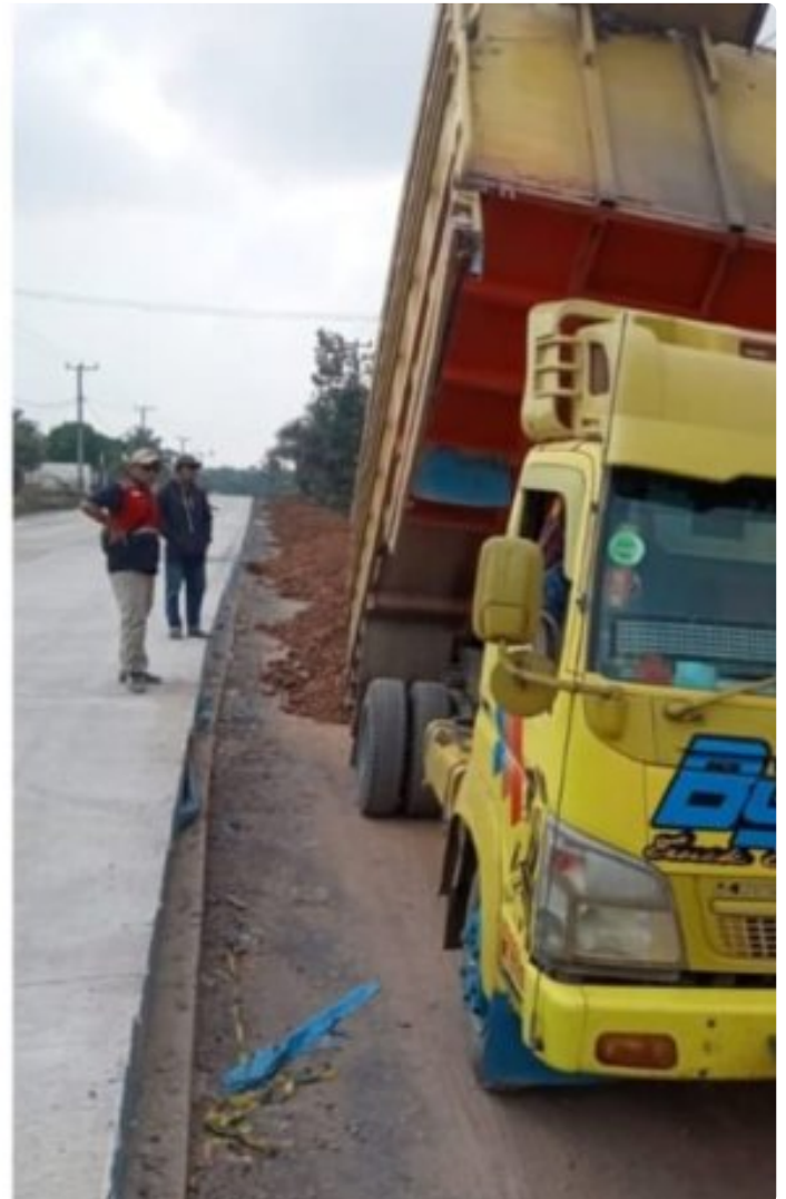
Mobil Pengangkut Tanah Galian C